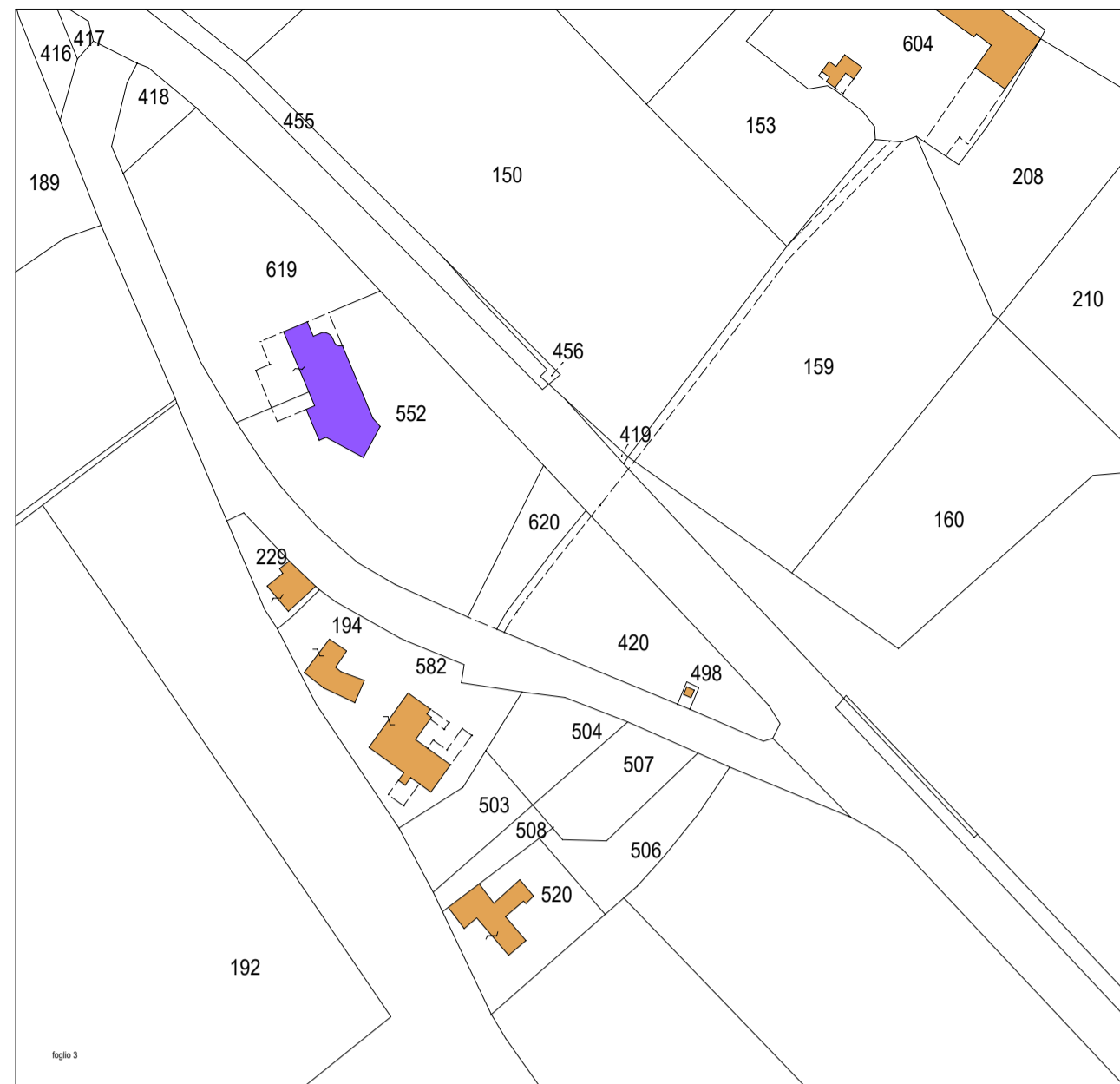
ESTRATTO CATASTALE: foglio 3, mappali n. 418, 619, 620 e 420.